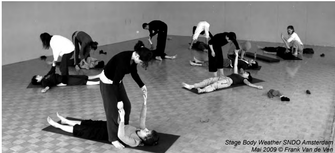
Stage Body Weather SNDO Amsterdam Mai 2009

Puis Frank montre un autre pas, cette fois plus difficile. Défiant notre coordination, on répète le pas: plus grand, plus petit, en diagonale, en marche arrière... Les tambours de la musique stimulent les mouvements, pourtant on ne suit pas la musique, elle nous accompagne. La concentration est indispensable, corps et esprit sautent à l'unisson. On évolue vers la