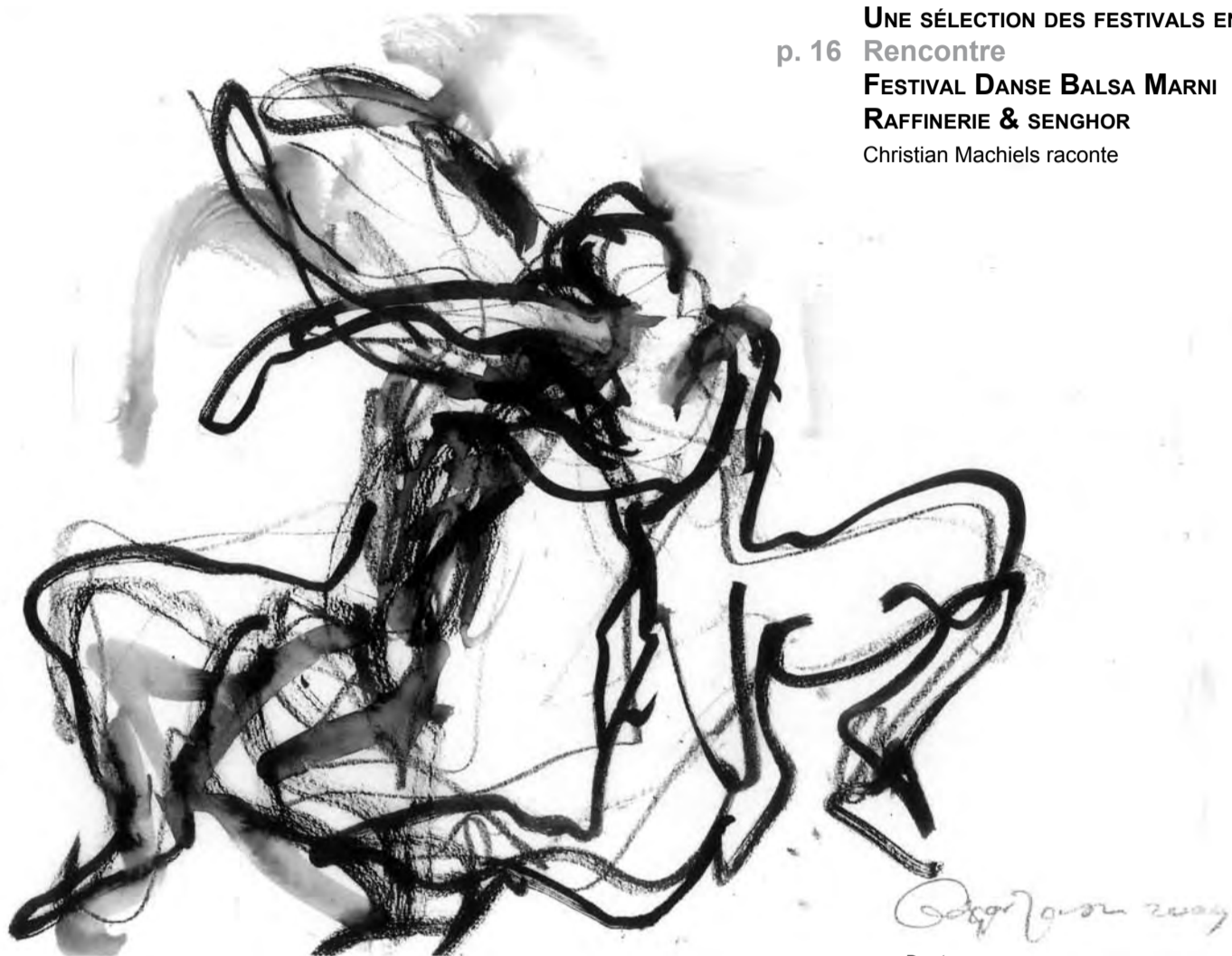
Duets Dessin Edgar Jansen

Prochaine parution: 1 er octobre 2010 (actualité octobre-novembre-décembre) Date limite de réception des informations: 30 août 2010 Email: ndd@contredanse.org Téléchargez NDD L'actualité de la danse du N°11 au N°48 sur www.contredanse.org