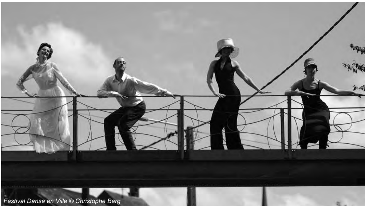
Festival Danse en Ville