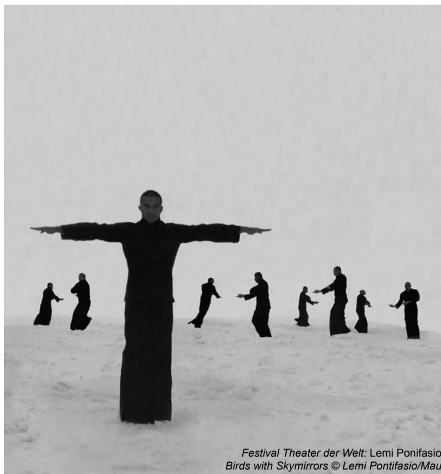
Festival Theater der Welt: Lemi Ponifasio Birds with Skymirrors

Cunningham Dance Company de 1973 à 1984, présente la recherche du chorégraphe basée sur les positions du dos et le hasard d'après le livre chinois bouddhiste I Ching encore appelé Le Livre des Transformations . L'édition 2010 accueille aussi Joseph Nadj, avec Length of 100 Needles , sa création entamée en 2007 dans sa ville natale de Kanisza en Yougoslavie. Christian Rizzo avec L'Oubli, toucher du bois , et Christophe Haleb avec Liquide seront également présents.