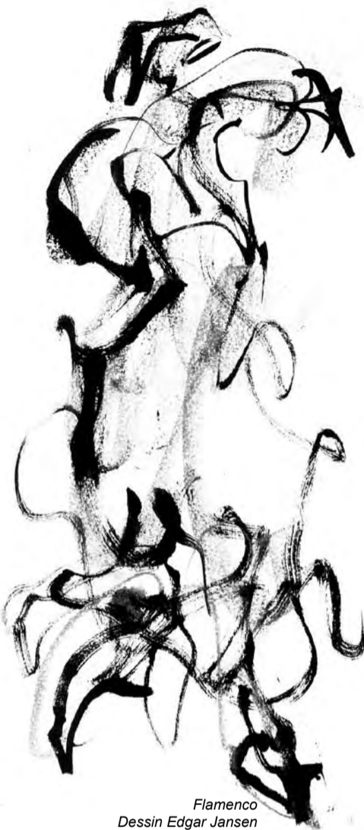
Flamenco Dessin Edgar Jansen