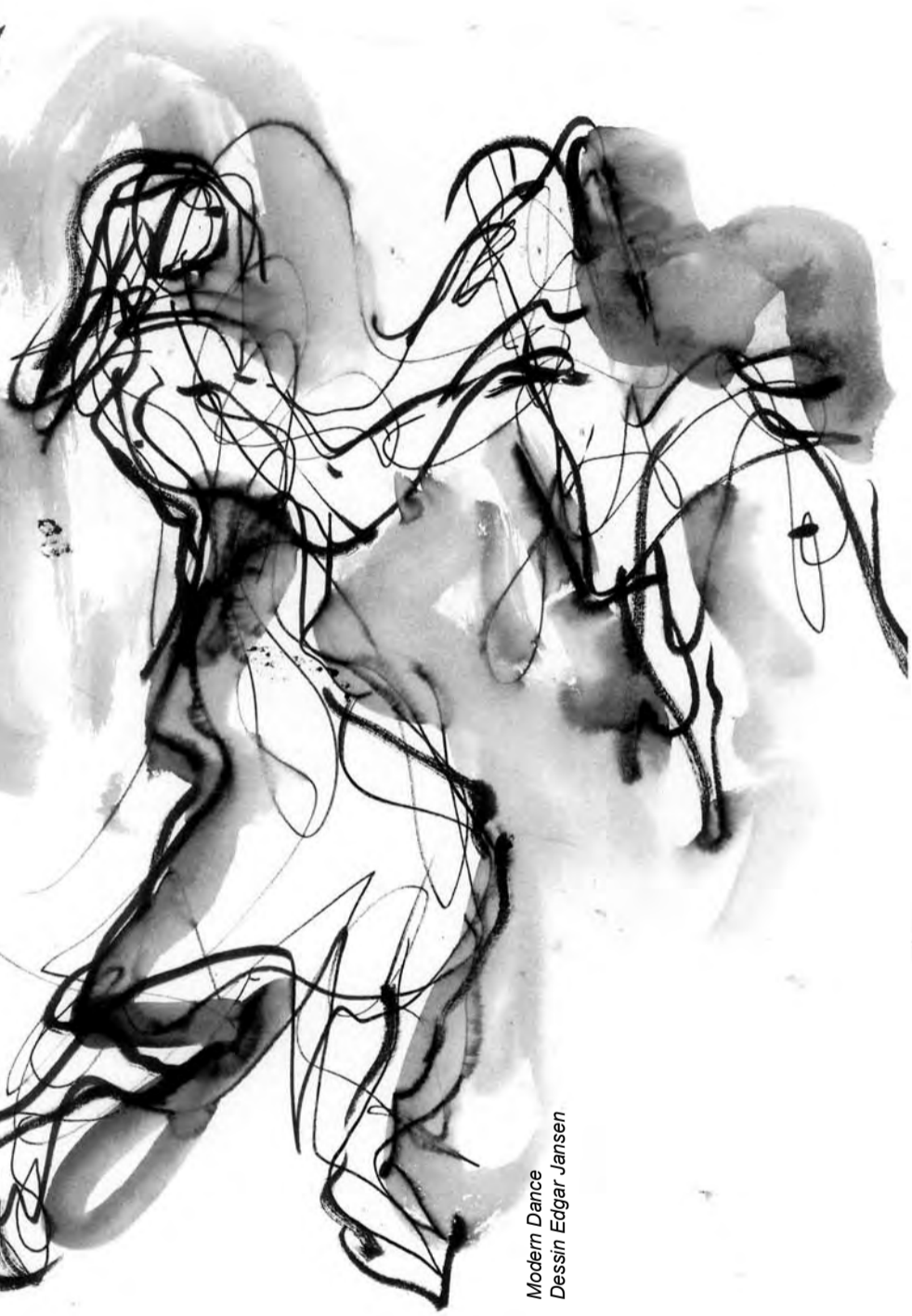
Modern Dance Dessin Edgar Jansen