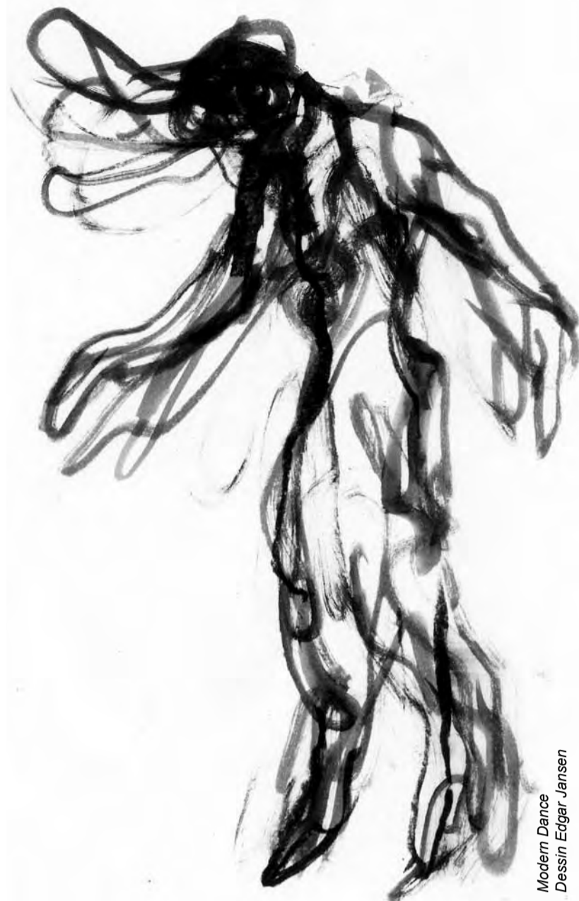
Modern Dance Dessin Edgar Jansen

Contact: T. +43 (0)6 769 39 77 11 www.edas-ballet-valencia.com