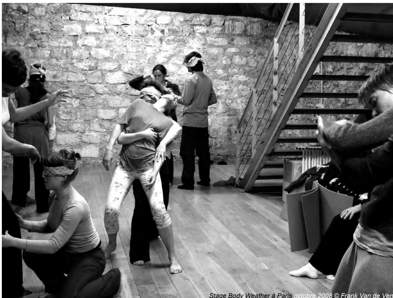
Stage Body Weather à Paris octobre 2008

Plus d'informations sur Body Weather Amsterdam: http://bodyweatheramsterdam.blogspot.com